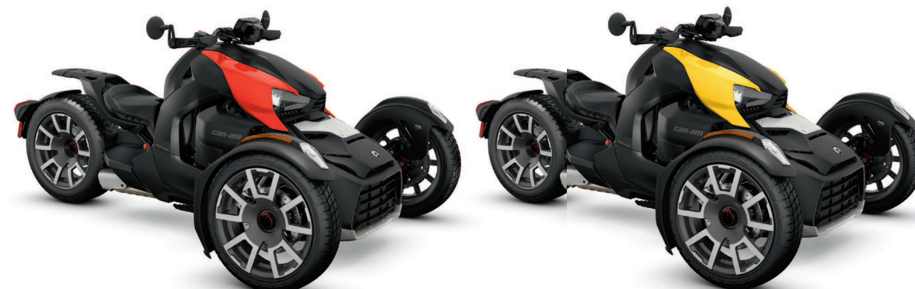
Zobrazený model s panelmi série Classic.