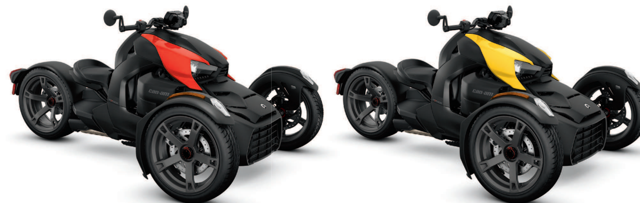
Zobrazený model s panelmi série Classic.