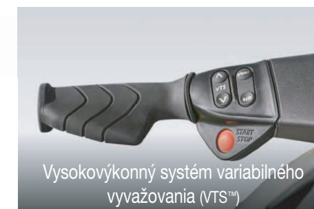
Vysokovýkonný systém variabilného vyvažovania (VTS™)

Táto exkluzívna funkcia Sea-Doo® optimalizuje výkon pri rôznych vodných podmienkach. Spolu s režimom ECO®, umožňujúcim zníženie spotreby až o 46 %.