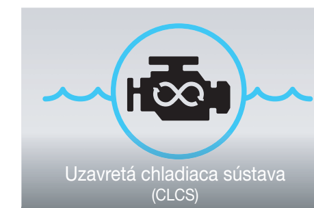
Uzavretá chladiaca sústava (CLCS)

Typická pre plavidlá Sea-Doo®, funkcia iBR® zastaví plavidlo skôr a umožňuje väčšiu ovládateľnosť a manérovateľnosť pri pomalých rýchlostiach a cúvaní.