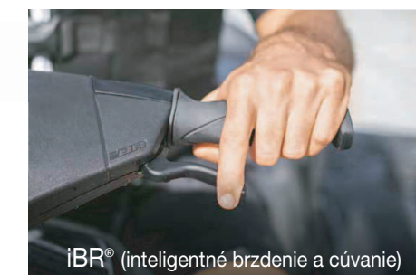
iBR® (inteligentné brzdenie a cúvanie)

Pohodlný a pritom pohyblivý pre predvídateľnú jazdu na stojatej a pokojnej vode.