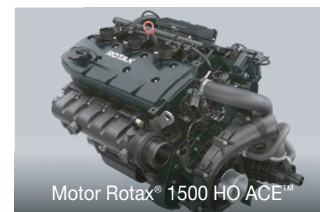
Motor Rotax® 1500 HO ACE™

Tento výkonný motor, vybavený technológiou zlepšenej účinnosti spaľovania (ACE) sa dodáva s bezúdržbovým turbodúchadlom a externým medzichladičom a je optimalizovaný pre úspornú spotrebu bežného paliva.