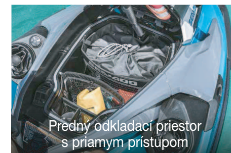
Predný odkladací priestor s priamym prístupom

Inovatívny trup, určujúci kritériá plavby na drsnej vode, stability a plavby pri pobreží.