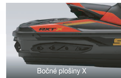
Bočné plošiny X

Od popredného výrobcu, vodotesná, s audiosystémom Bluetooth†.