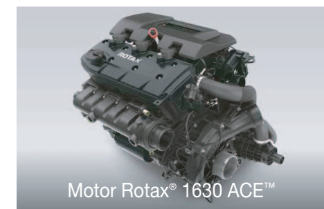
Motor Rotax® 1630 ACE™

Veľký objem predného odkladacieho priestoru, ktorý je pohodlne prístupný priamo zo sedadla.